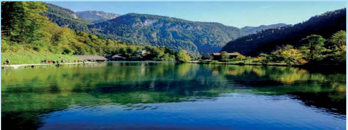
Chiemsee und Berchtesgadener Land